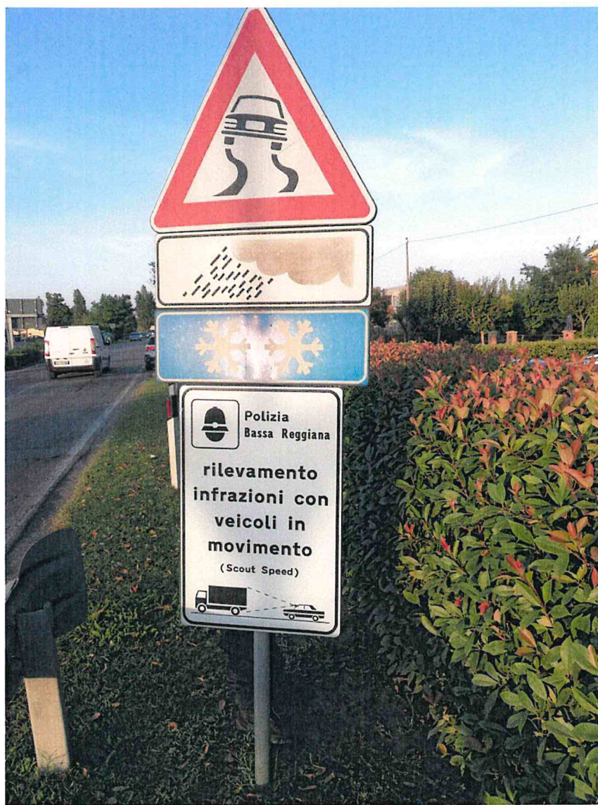
3. VIA PROVINCIALE NORD CIVICO 247 DIREZIONE NOVELLARA